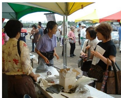
生ごみ堆肥の説明にも力が・・・